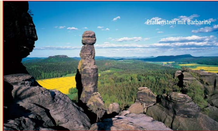
Pfaffenstein mit Barbarine